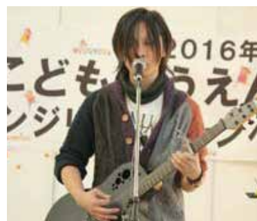
画像：昨年の広場の様子